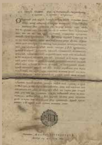
Указ Петра Первого 1714 г.